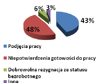
Przyczyny utraty statusu bezrobotnego

Osoby zarejestrowane w naszym urzędzie mogły skorzystać z usług specjalistów Centrum Aktywizacji Zawodowej, między innymi z usług pośredników pracy, którzy w czerwcu br.