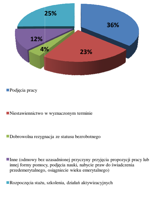
Przyczyny utraty statusu bezrobotnego - lipiec 2017r.

Osoby zainteresowane podjęciem zatrudnienia za granicą miały do dyspozycji 182 oferty zgłoszone przez pracodawców zagranicznych w ramach sieci EURES. Zagraniczne oferty pracy zgłaszane przez pracodawców to: pracownik do pakowania sadzonek truskawek, opiekun klienta niemieckojęzyczny, opiekun klienta z językiem niderlandzkim, pomocnik w branży logistycznej, monter regałów sklepowych, kierowca C+E, pomocnik opiekuna osób starszych, mechanik pojazdów ciężarowych, elektryk, operator wózka widłowego, spawacz TIG, ślusarz, doradca ds. telefonicznej obsługi klienta, kosmetolog.