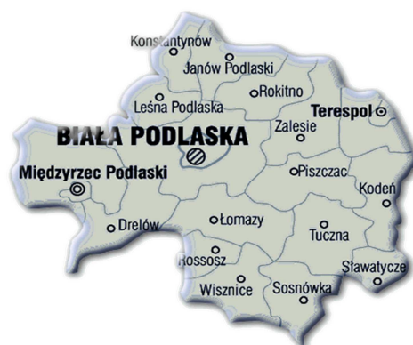
Dane statystyczne - październik 2012r.

Liczba osób bezrobotnych zarejestrowanych w Powiatowym Urzędzie Pracy w Białej Podlaskiej wg stanu na koniec października 2012r. wyniosła 10084 w tym 4963 kobiety i jest o 204 osoby mniejsza w porównaniu do miesiąca poprzedniego. W mieście Biała Podlaska liczba bezrobotnych wynosiła 3593 osoby, natomiast w powiecie bialskim 6491 osób. Obszar działania naszego urzędu charakteryzuje się nadal wysoką stopą bezrobocia, która według stanu na koniec września 2012r. wyniosła 15,4% w mieście Biała Podlaska oraz 15,1% w powiecie bialskim. Dla porównania w województwie lubelskim wyniosła 13,0% natomiast w kraju 12,4% .