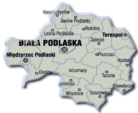
Dane statystyczne - październik 2013r.

Liczba osób bezrobotnych zarejestrowanych w Powiatowym Urzędzie Pracy w Białej Podlaskiej wg stanu na koniec października 2013r. wyniosła 10498 w tym 5010 kobiet i jest o 142 osoby mniejsza w porównaniu do miesiąca poprzedniego. W mieście Biała Podlaska liczba bezrobotnych wynosiła 3818 osób , natomiast w powiecie białskim 6680 osób . Obszar działania naszego urzędu charakteryzuje się nadal wysoką stopą bezrobocia, która według stanu na koniec września 2013r. wyniosła 16,3% w mieście Biała Podlaska oraz 15,6% w powiecie białskim. Dla porównania w województwie lubelskim wyniosła 13,8% natomiast w kraju 13,0% .