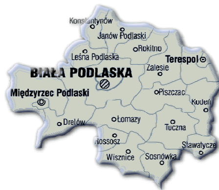
Dane statystyczne - sierpień 2015r.

Liczba osób bezrobotnych zarejestrowanych w Powiatowym Urzędzie Pracy w Białej Podlaskiej wg stanu na koniec sierpnia 2015r. wyniosła 8810 w tym 4182 kobiety i jest o 165 osób mniejsza w porównaniu do miesiąca poprzedniego. W mieście Biała Podlaska liczba bezrobotnych wynosiła 3250 osób , natomiast w powiecie białskim 5560 osób . Stopa bezrobocia na obszarze działania naszego urzędu na koniec lipca 2015r. wyniosła 13,9% w mieście Biała Podlaska oraz 13,1% w powiecie białskim. Dla porównania w województwie lubelskim wyniosła 11,4% , natomiast w kraju 10,1% .